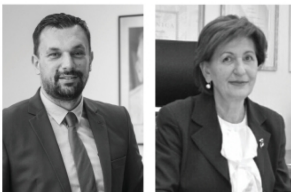
Elmedin Konaković Premijer KS