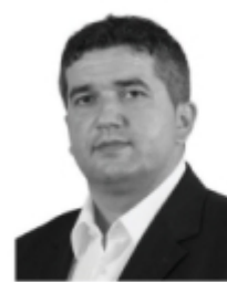
Sabahudin Delalić SDA