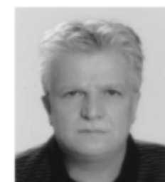
Fahrudin Pecikoza Samostalni poslanik